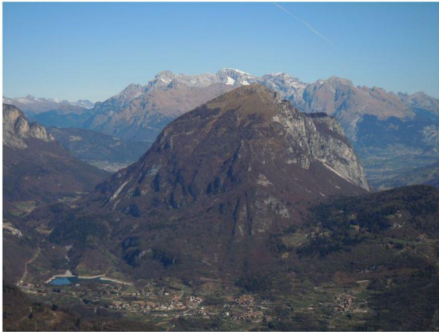
Panorama di vetta verso il Brenta, Monte Misone e il Lago di Tenno